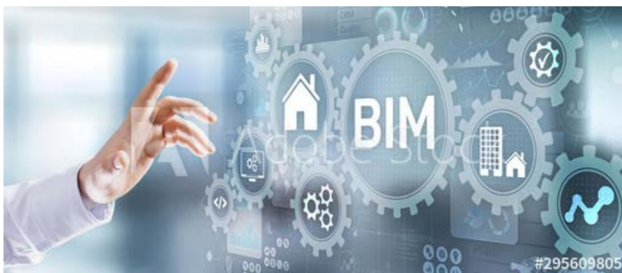
Digitale Zwillings in der Baubranche: Building Information Modelling (BIM)

In der Realisierungsphase ist der Digitale Zwilling die zentrale Datenbasis für alle Gewerke. Bodenplatte, Stahlbau, Brandschutz, Tore, Fördertechnik, Steuerungstechnik, Lagerverwaltungssystem, etc. Jeder Projektbeteiligte arbeitet online mit dem Modell des digitalen Zwillings. Ändert der Stahlbauer seine Konstruktion, fließt diese sofort ins Modell ein und ist z.B. für das Gewerk Dach- und Wandverkleidung ebenfalls sichtbar.